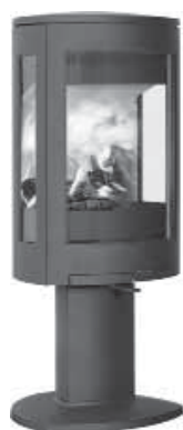
Jøtul F 373 Advance